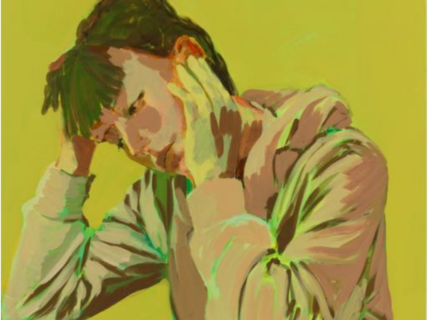
Claire Tabouret Self-portrait at the Table , 2020. Acrylic on canvas. 100 x 81 x 2 cm.