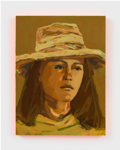
Claire Tabouret Self-Portrait as a Tired Gold Miner , 2020. Acrylic on panel 61 x 46 x 3.8 cm.

countryside where she lived, Tabouret reflects that, “it was in this very natural way that I began painting myself, because the urgency to paint is always there, no matter what.”