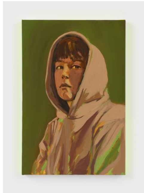
Claire Tabouret Self-portrait with a Hood (purple) , 2020 Acrylic on panel. 76 x 51 x 3.5 cm. Courtesy of the Artist and Perrotin.

Despite Tabouret being the only subject in the works, it quickly becomes evident that she is withdrawing from the viewer, perhaps only an instant away from vanishing entirely. The figure’s visage is the same but not uniform, marking the passage of time and honoring the fleeting nature of the human face. These works convey a sense of