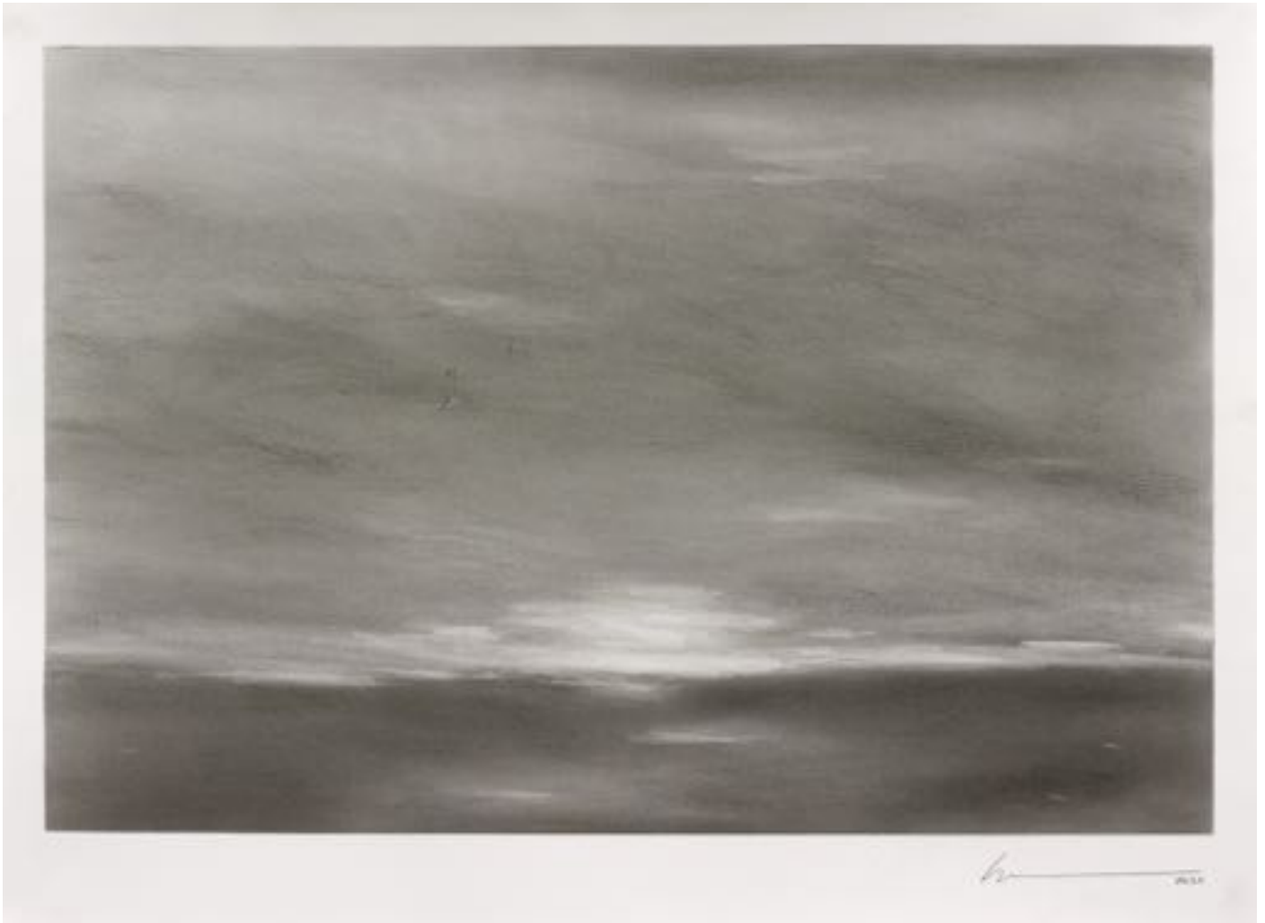
Robert Wilson, Der Messias 012.07.24.20, 2020.