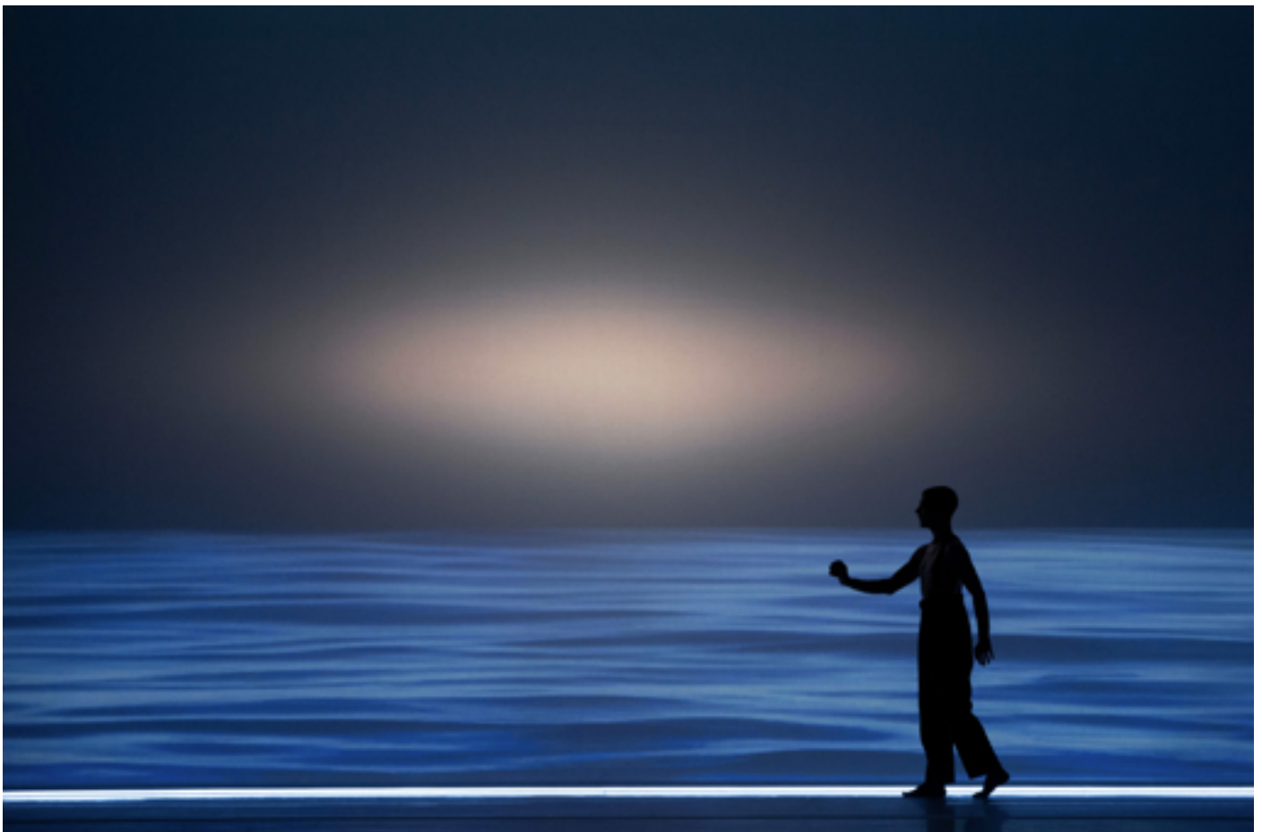
View of Der Messias , at Grosses Festspielhaus, Salzburg, 2019.