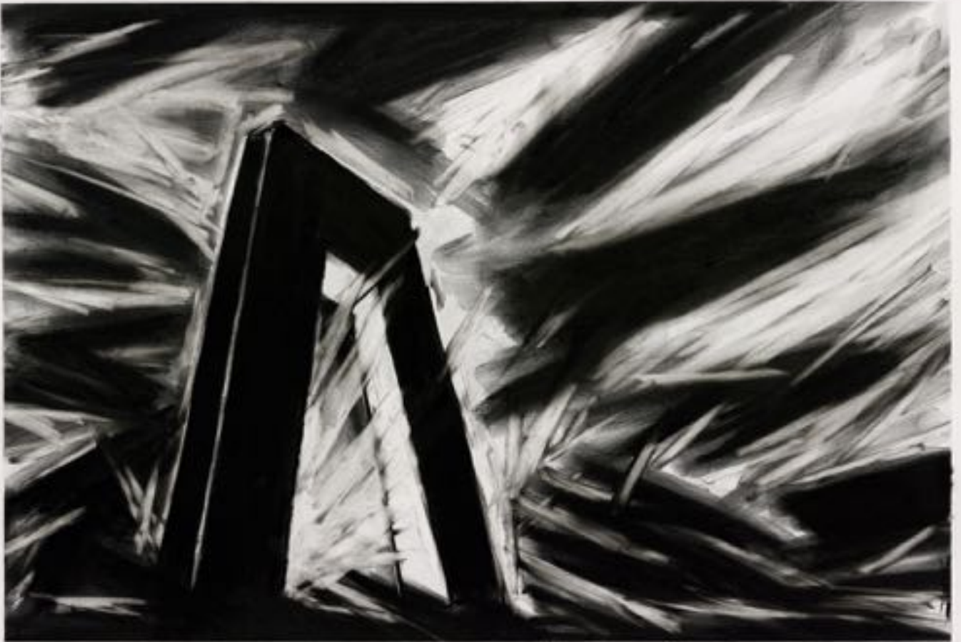
Robert Wilson, Der Messias 011.07.24.20, 2020.