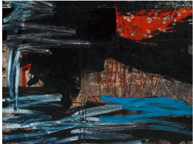
Oscar Murillo, manifestation , 2019 (detail). © Oscar Murillo Courtesy the artist and David Zwirner

Opening 21 October 2020 108, rue Vieille du Temple 75003 Paris