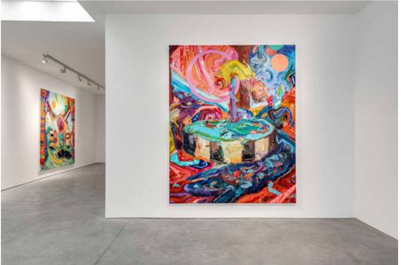
La plainte de Yam, Vue d'exposition, Art : Concept, Paris, 12 septembre - 24 octobre 2020 La plainte de Yam, Installation view, Art : Concept, Paris, 12th September - 24th October 2020

Art : Concept 4 passage Sainte-Avoye, Paris 0033 1 53 60 90 30 www.galerieartconcept.com