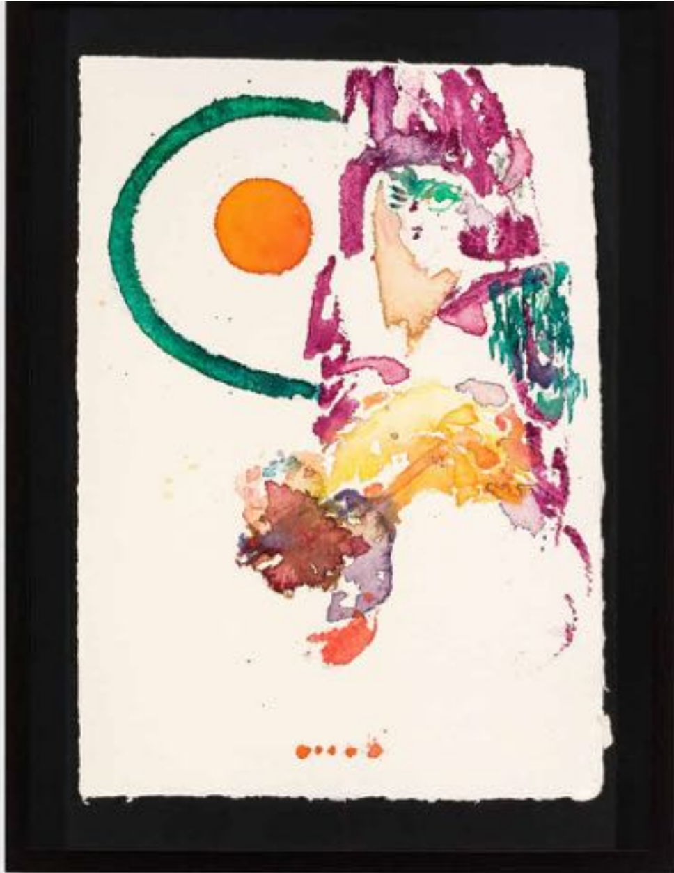
Miryam HADDAD La fonte des cieux , 2020 ref 12283 Aquarelle, papier Watercolour, paper 36 x 27 cm ( 14 1/8 x 10 5/8 in. )

Art : Concept 4 passage Sainte-Avoye, Paris 0033 1 53 60 90 30 www.galerieartconcept.com