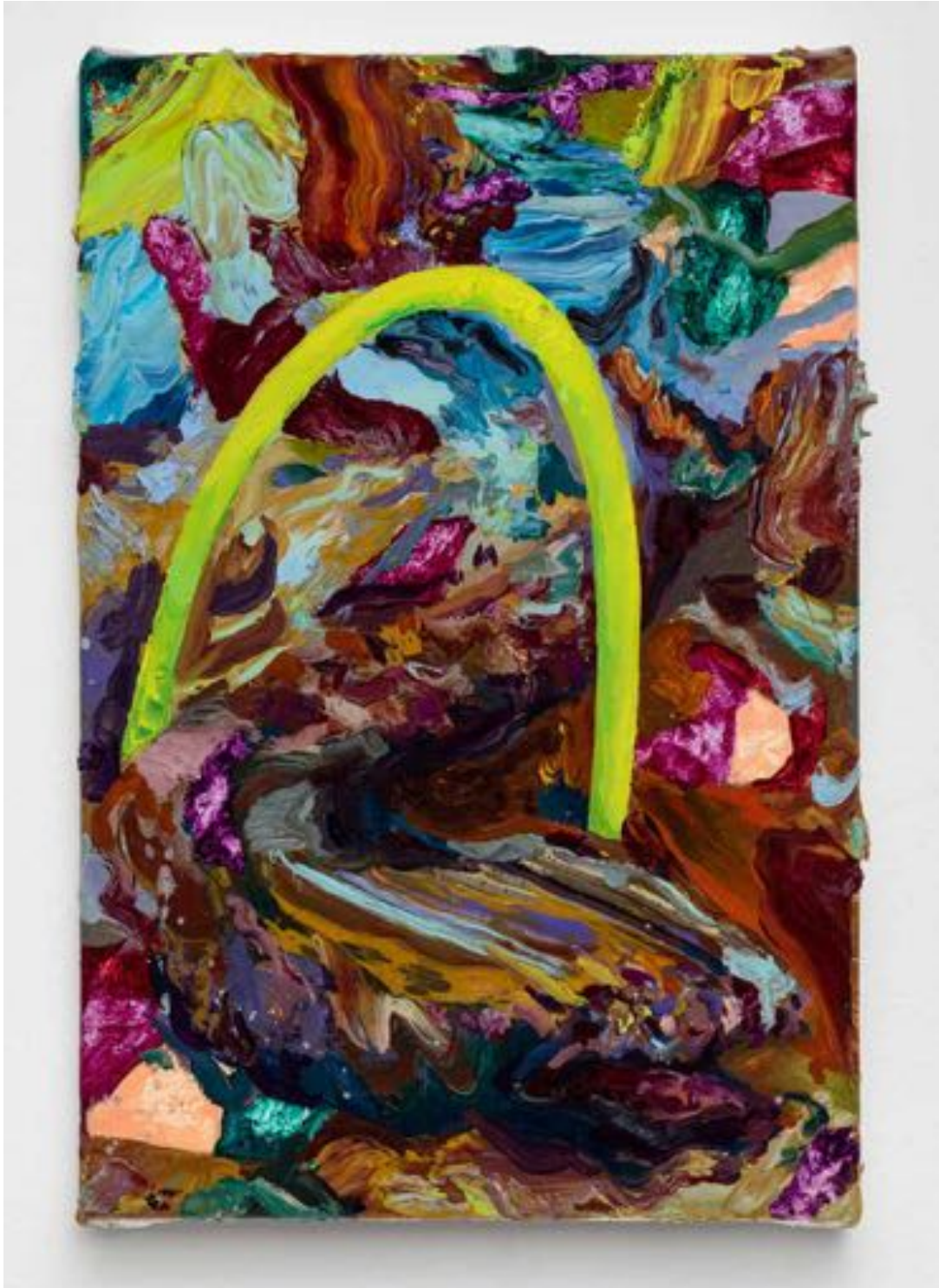
Miryam HADDAD Le naufrage des flots , 2020 huile sur toile oil on canvas 22 x 16 cm (8 5/8 x 6 1/4 in.)

Art: Concept 4 passage Sainte-Avoye, Paris 0033 1 53 60 90 30 www.galerieartconcept.com