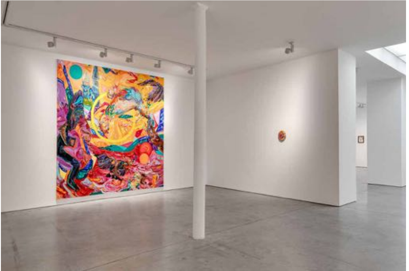
La plainte de Yam, Vue d'exposition, Art : Concept, Paris, 12 septembre - 24 octobre 2020 La plainte de Yam, Installation view, Art : Concept, Paris, 12th September - 24th October 2020

Art : Concept 4 passage Sainte-Avoye, Paris 0033 1 53 60 90 30 www.galerieartconcept.com