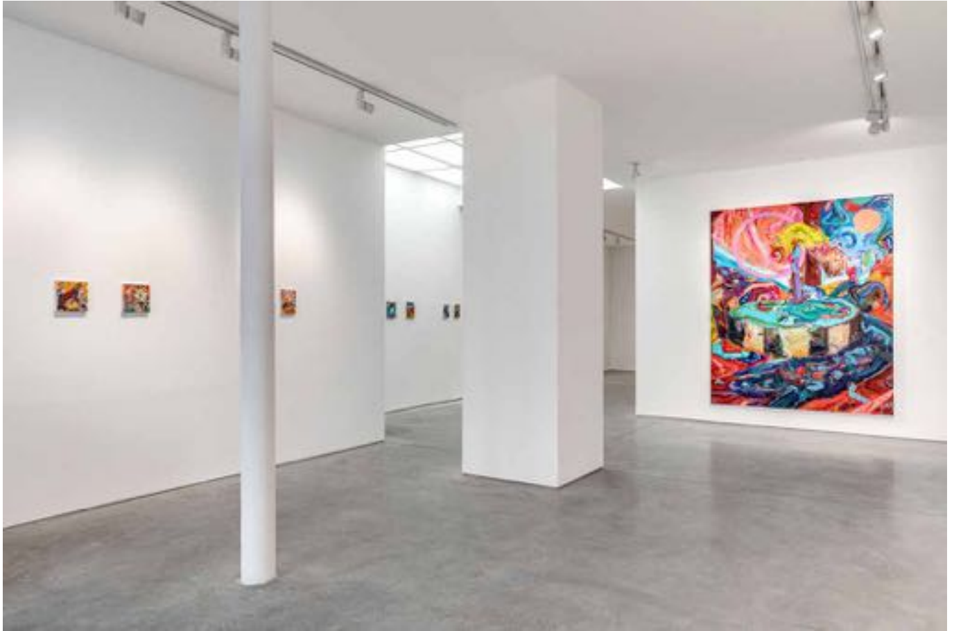
La plainte de Yam, Vue d'exposition, Art : Concept, Paris, 12 septembre - 24 octobre 2020 La plainte de Yam, Installation view, Art : Concept, Paris, 12th September - 24th October 2020

Art : Concept 4 passage Sainte-Avoye, Paris 0033 1 53 60 90 30 www.galerieartconcept.com