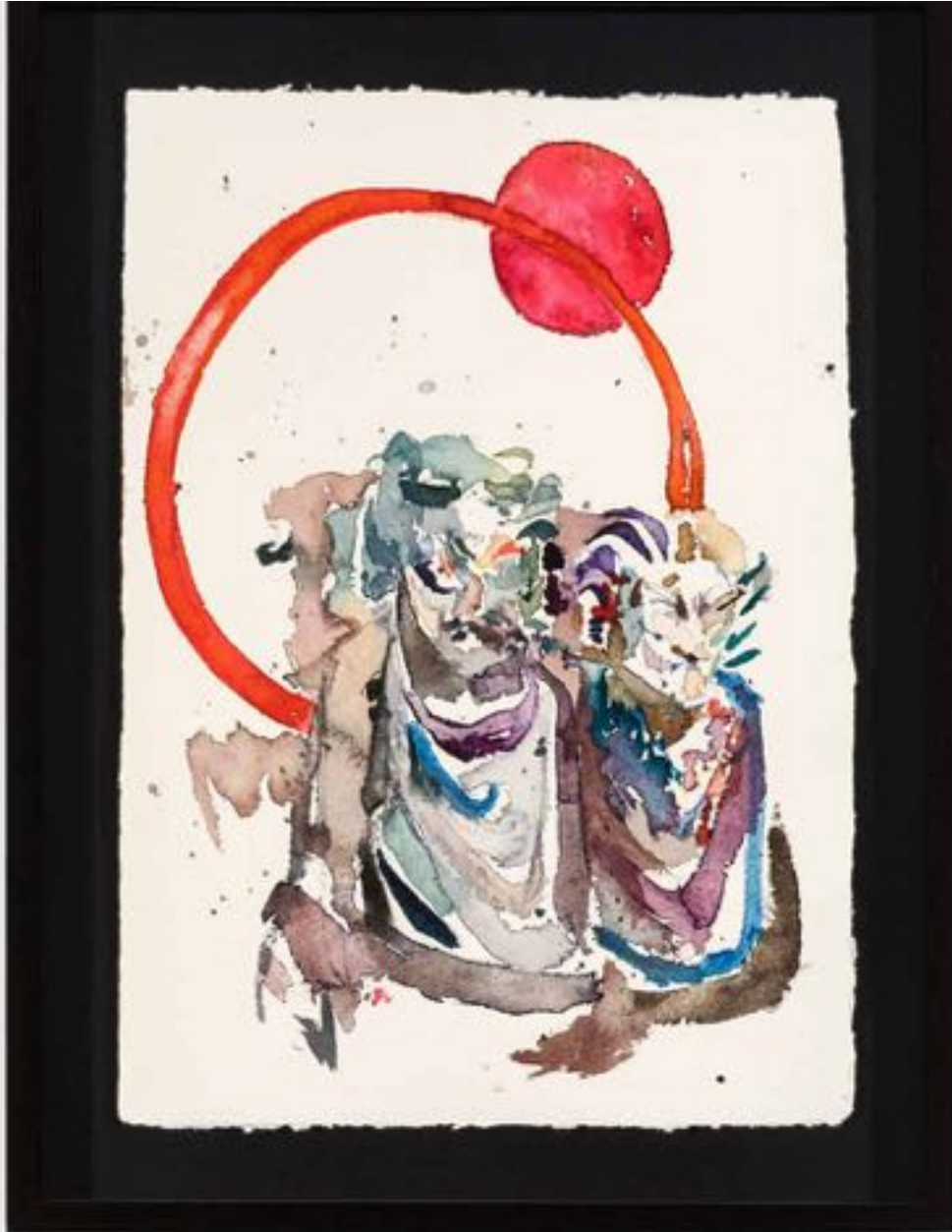
Miryam HADDAD La fonte des cieux , 2020 ref 12273 Aquarelle, papier Watercolour, paper 36 x 27 cm ( 14 1/8 x 10 5/8 in. )

Art : Concept 4 passage Sainte-Avoye, Paris 0033 1 53 60 90 30 www.galerieartconcept.com