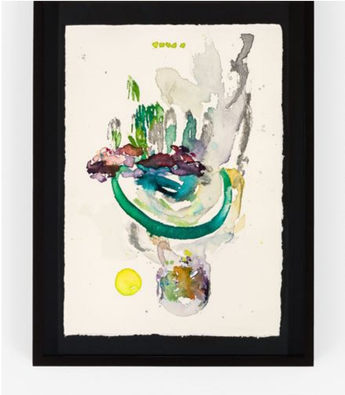
Miryam HADDAD La fonte des cieux , 2020 ref 12278 Aquarelle, papier Watercolour, paper 36 x 27 cm (14 1/8 x 10 5/8 in.)

Art : Concept 4 passage Sainte-Avoye, Paris 0033 1 53 60 90 30 www.galerieartconcept.com