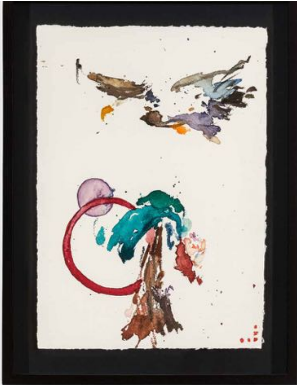
Miryam HADDAD La fonte des cieux , 2020 ref 12284 Aquarelle, papier Watercolour, paper 36 x 27 cm (14 1/8 x 10 5/8 in.)

Art : Concept 4 passage Sainte-Avoye, Paris 0033 1 53 60 90 30 www.galerieartconcept.com