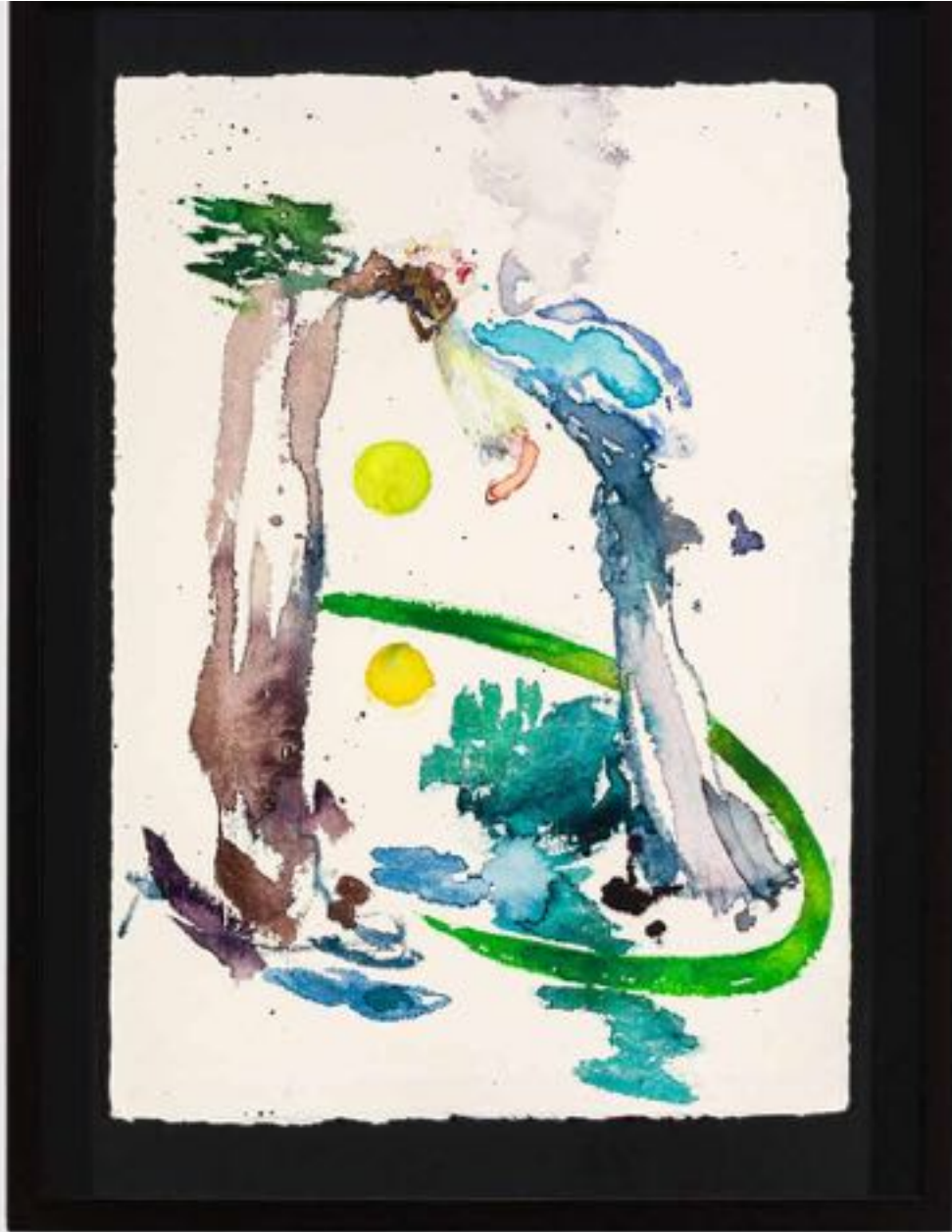
Miryam HADDAD La fonte des cieux , 2020 ref 12279 Aquarelle, papier Watercolour, paper 36 x 27 cm (14 1/8 x 10 5/8 in.)

Art : Concept 4 passage Sainte-Avoye, Paris 0033 1 53 60 90 30 www.galerieartconcept.com