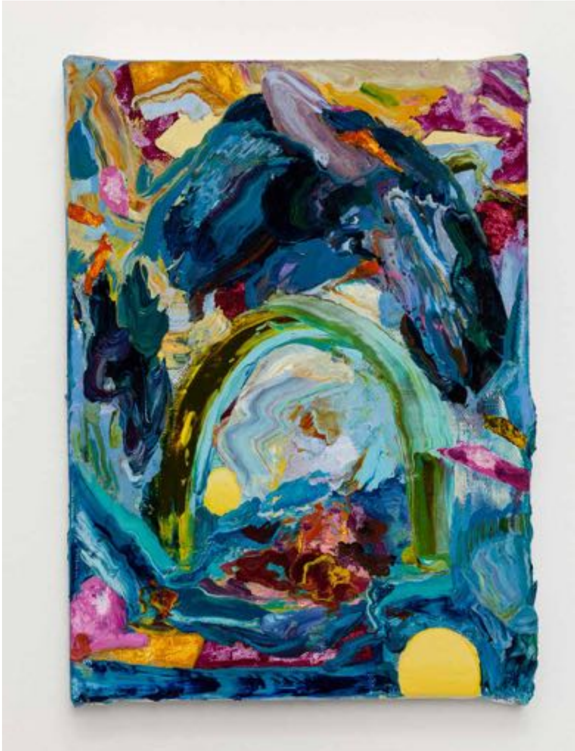
Miryam HADDAD Sous une ombre hâtive , 2020 huile sur toile oil on canvas 24 x 19 cm (9 1/2 x 7 1/2 in.)

Art: Concept 4 passage Sainte-Avoye, Paris 0033 1 53 60 90 30 www.galerieartconcept.com