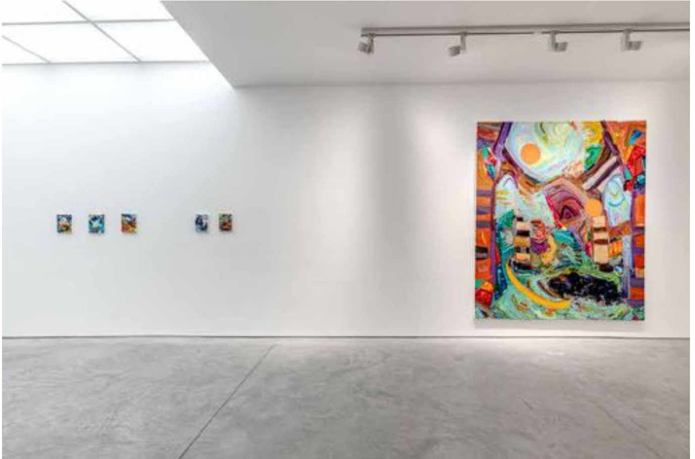
La plainte de Yam, Vue d'exposition, Art : Concept, Paris, 12 septembre - 24 octobre 2020 La plainte de Yam, Installation view, Art : Concept, Paris, 12th September - 24th October 2020

Art : Concept 4 passage Sainte-Avoye, Paris 0033 1 53 60 90 30 www.galerieartconcept.com