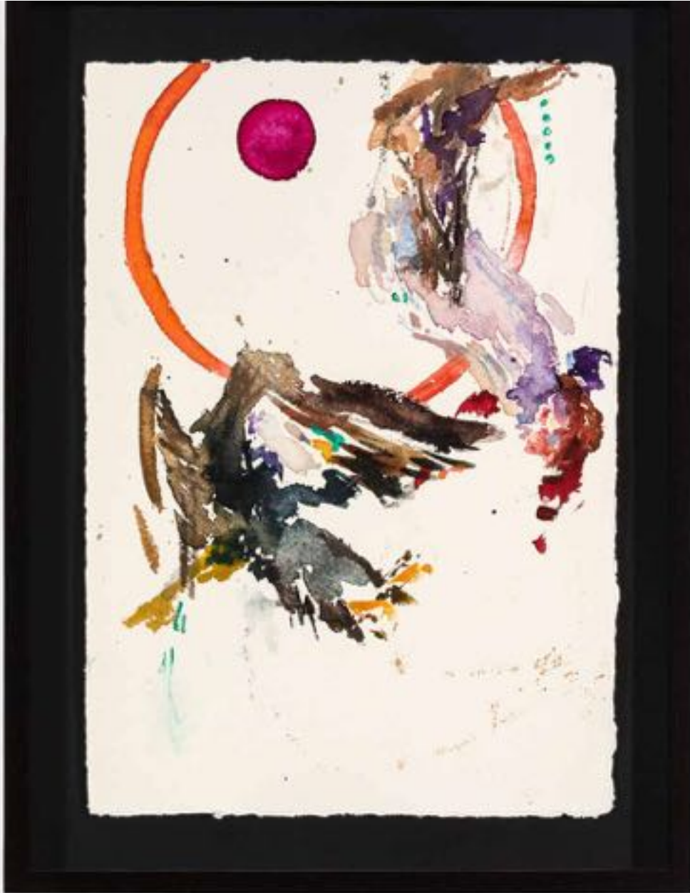
Miryam HADDAD La fonte des cieux , 2020 ref 12277 Aquarelle, papier Watercolour, paper 36 x 27 cm (14 1/8 x 10 5/8 in.)

Art : Concept 4 passage Sainte-Avoye, Paris 0033 1 53 60 90 30 www.galerieartconcept.com