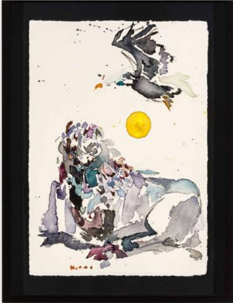
Miryam HADDAD La fonte des cieux , 2020 ref 12281 Aquarelle, papier Watercolour, paper 36 x 27 cm (14 1/8 x 10 5/8 in.)

Art : Concept 4 passage Sainte-Avoye, Paris 0033 1 53 60 90 30 www.galerieartconcept.com