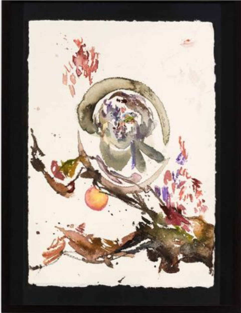
Miryam HADDAD La fonte des cieux , 2020 ref 12285 Aquarelle, papier Watercolour, paper 36 x 27 cm (14 1/8 x 10 5/8 in.)

Art : Concept 4 passage Sainte-Avoye, Paris 0033 1 53 60 90 30 www.galerieartconcept.com