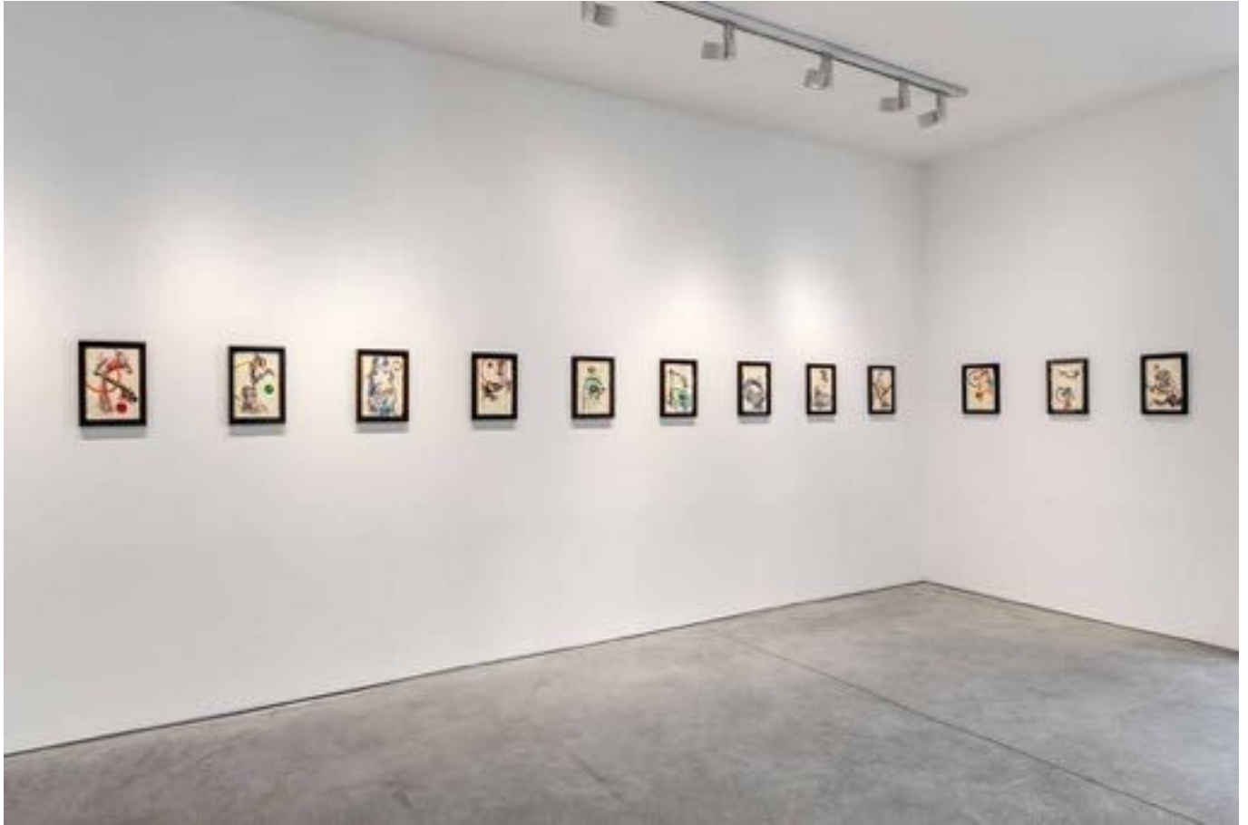
La plainte de Yam, Vue d'exposition, Art : Concept, Paris, 12 septembre - 24 octobre 2020 La plainte de Yam, Installation view, Art : Concept, Paris, 12th September - 24th October 2020

Art : Concept 4 passage Sainte-Avoye, Paris 0033 1 53 60 90 30 www.galerieartconcept.com