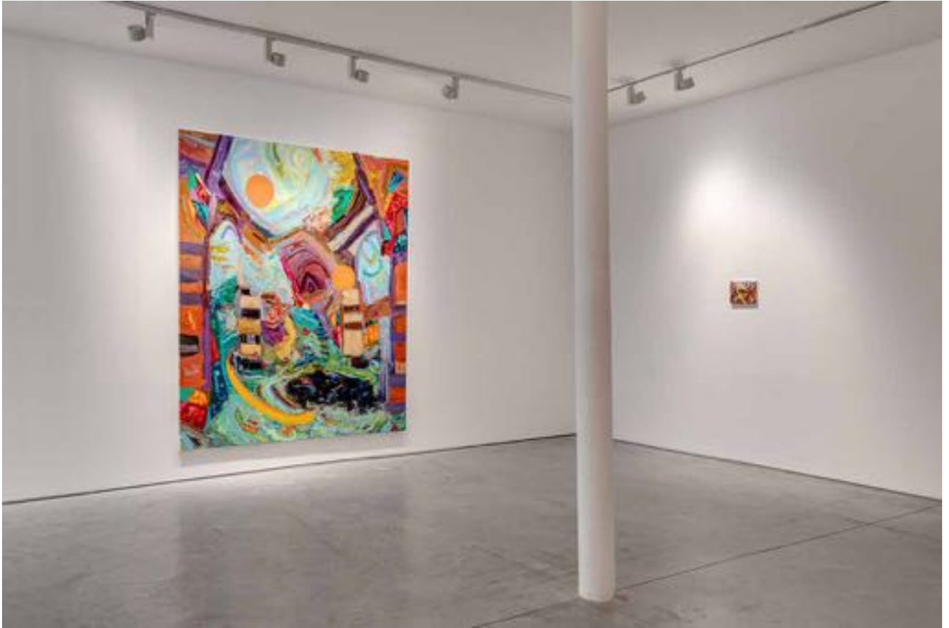
La plainte de Yam, Vue d'exposition, Art : Concept, Paris, 12 septembre - 24 octobre 2020 La plainte de Yam, Installation view, Art : Concept, Paris, 12th September - 24th October 2020

Art : Concept 4 passage Sainte-Avoye, Paris 0033 1 53 60 90 30 www.galerieartconcept.com