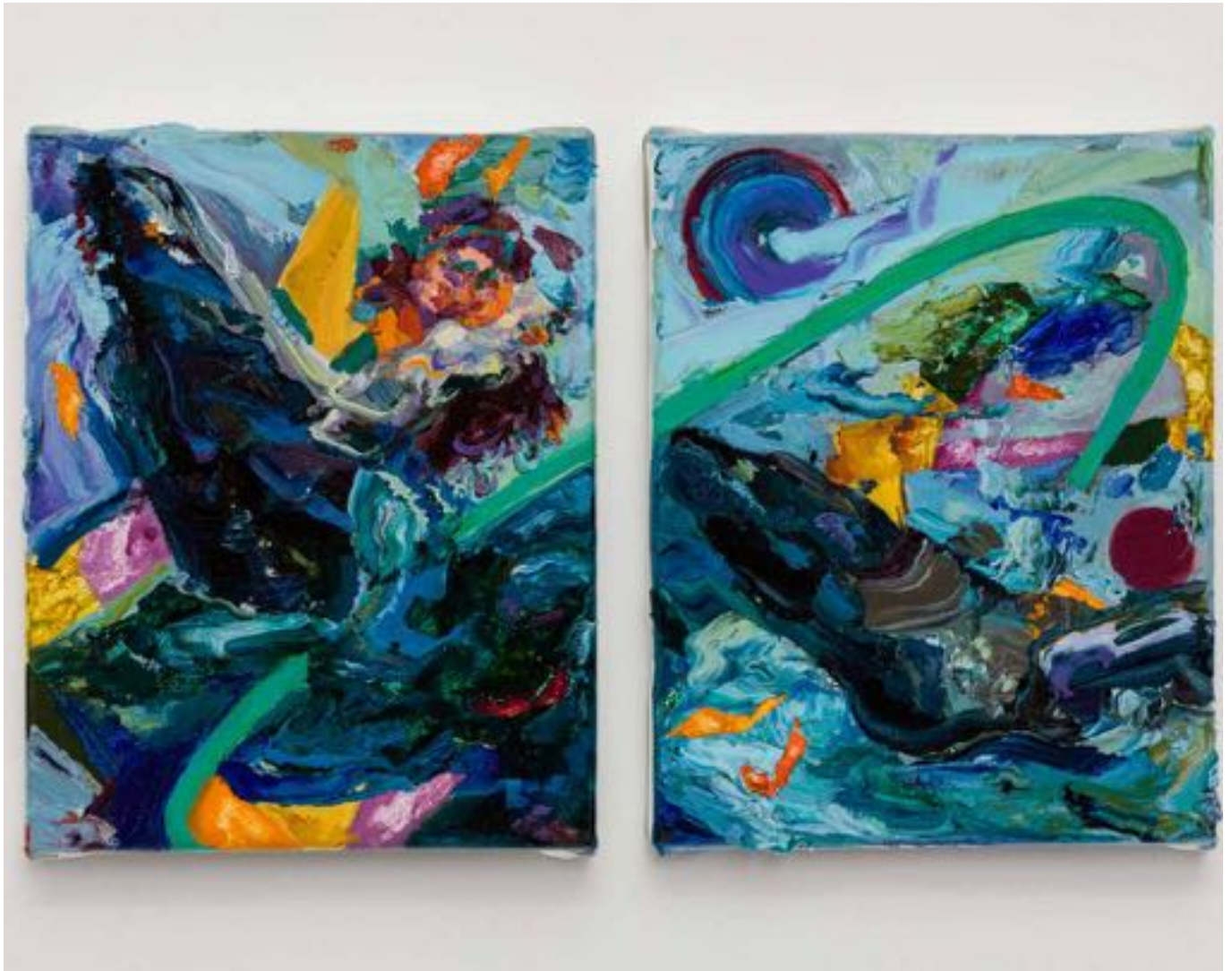
Miryam HADDAD Fidèles à la cime des vents , 2020 huile sur toile, diptyque chaque, 18 x 14 cm oil on canvas, diptych each (7 1/8 x 5 1/2 in.)

Art: Concept 4 passage Sainte-Avoye, Paris 0033 1 53 60 90 30 www.galerieartconcept.com