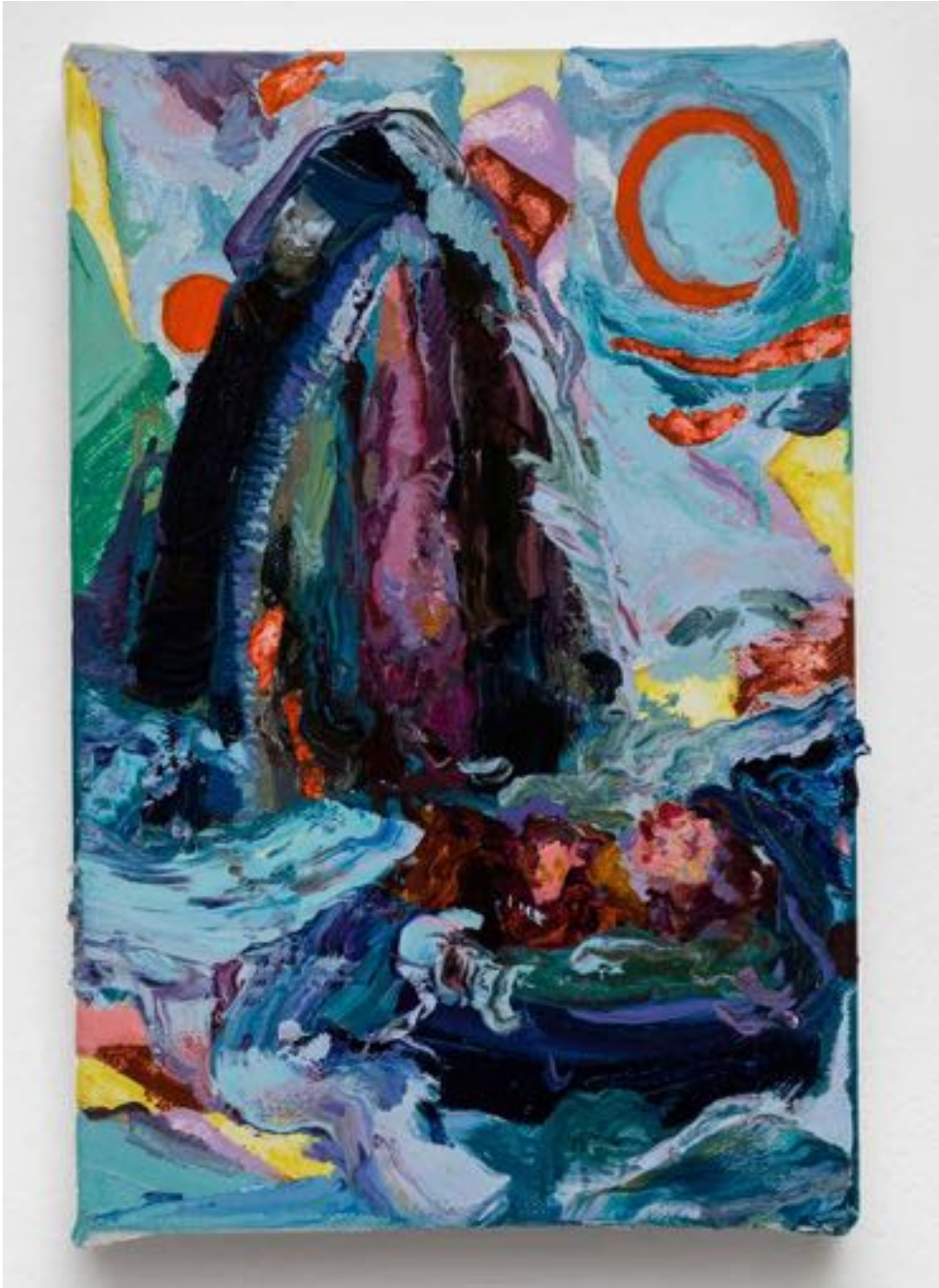
Miryam HADDAD L'écume des protecteurs , 2020 huile sur toile oil on canvas 22 x 16 cm (8 5/8 x 6 1/4 in.)

Art: Concept 4 passage Sainte-Avoye, Paris 0033 1 53 60 90 30 www.galerieartconcept.com