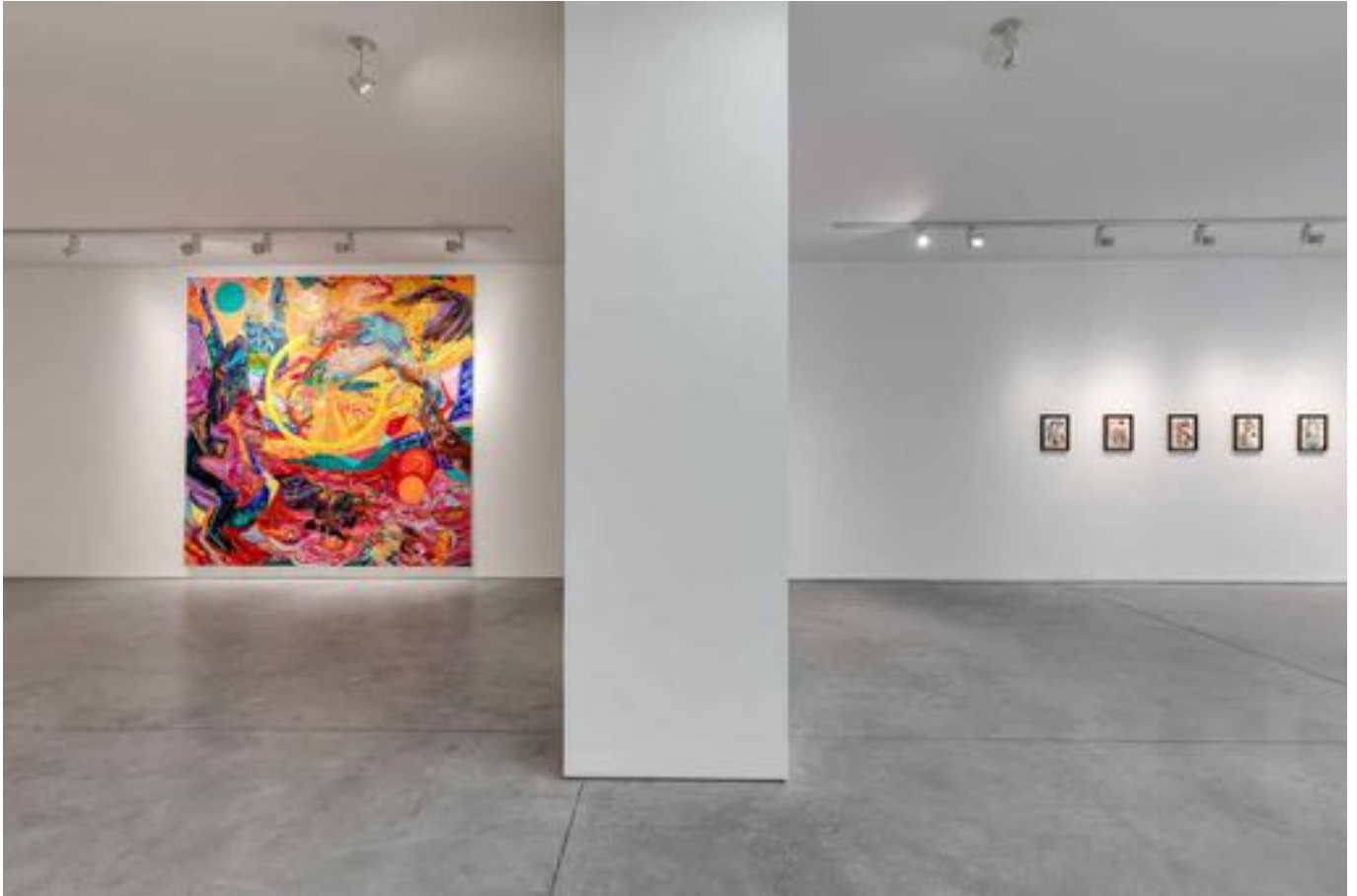
La plainte de Yam, Vue d'exposition, Art : Concept, Paris, 12 septembre - 24 octobre 2020 La plainte de Yam, Installation view, Art : Concept, Paris, 12th September - 24th October 2020

Art : Concept 4 passage Sainte-Avoye, Paris 0033 1 53 60 90 30 www.galerieartconcept.com