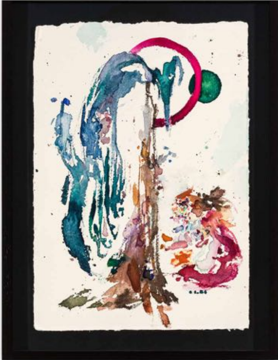
Miryam HADDAD La fonte des cieux , 2020 ref 12272 Aquarelle, papier Watercolour, paper 36 x 27 cm (14 1/8 x 10 5/8 in.)

Art : Concept 4 passage Sainte-Avoye, Paris 0033 1 53 60 90 30 www.galerieartconcept.com