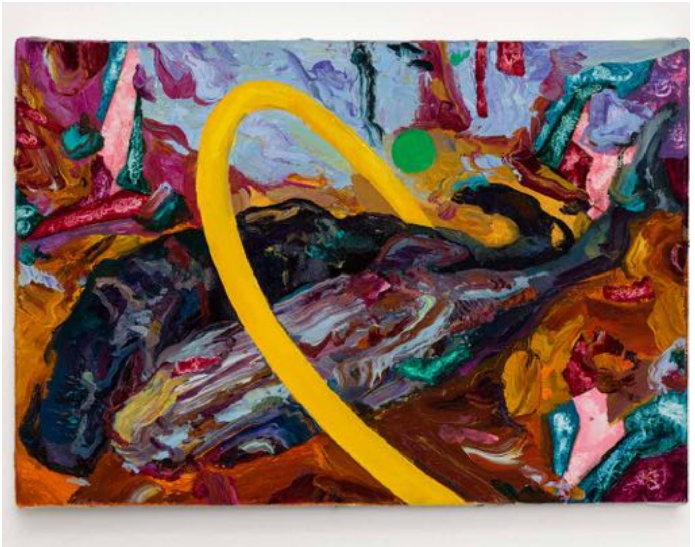
Miryam HADDAD L'hymne des dieux , 2020 huile sur toile oil on canvas 19 x 27 cm (7 1/2 x 10 5/8 in.)

Art: Concept 4 passage Sainte-Avoye, Paris 0033 1 53 60 90 30 www.galerieartconcept.com