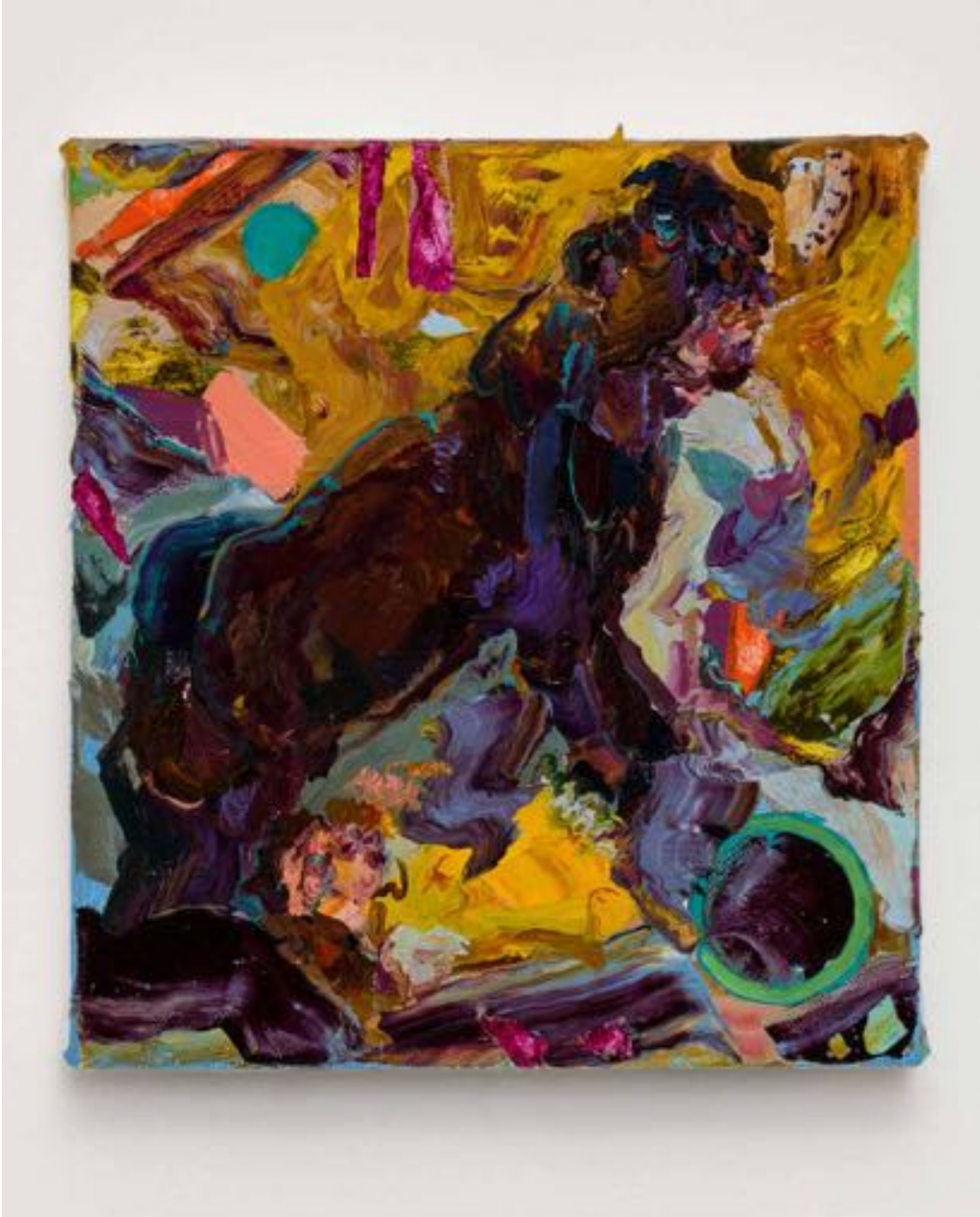
Miryam HADDAD Ardeur de la terre , 2020 huile sur toile oil on canvas 20 x 20 cm (7 7/8 x 7 7/8 in.)

Art : Concept 4 passage Sainte-Avoye, Paris 0033 1 53 60 90 30 www.galerieartconcept.com