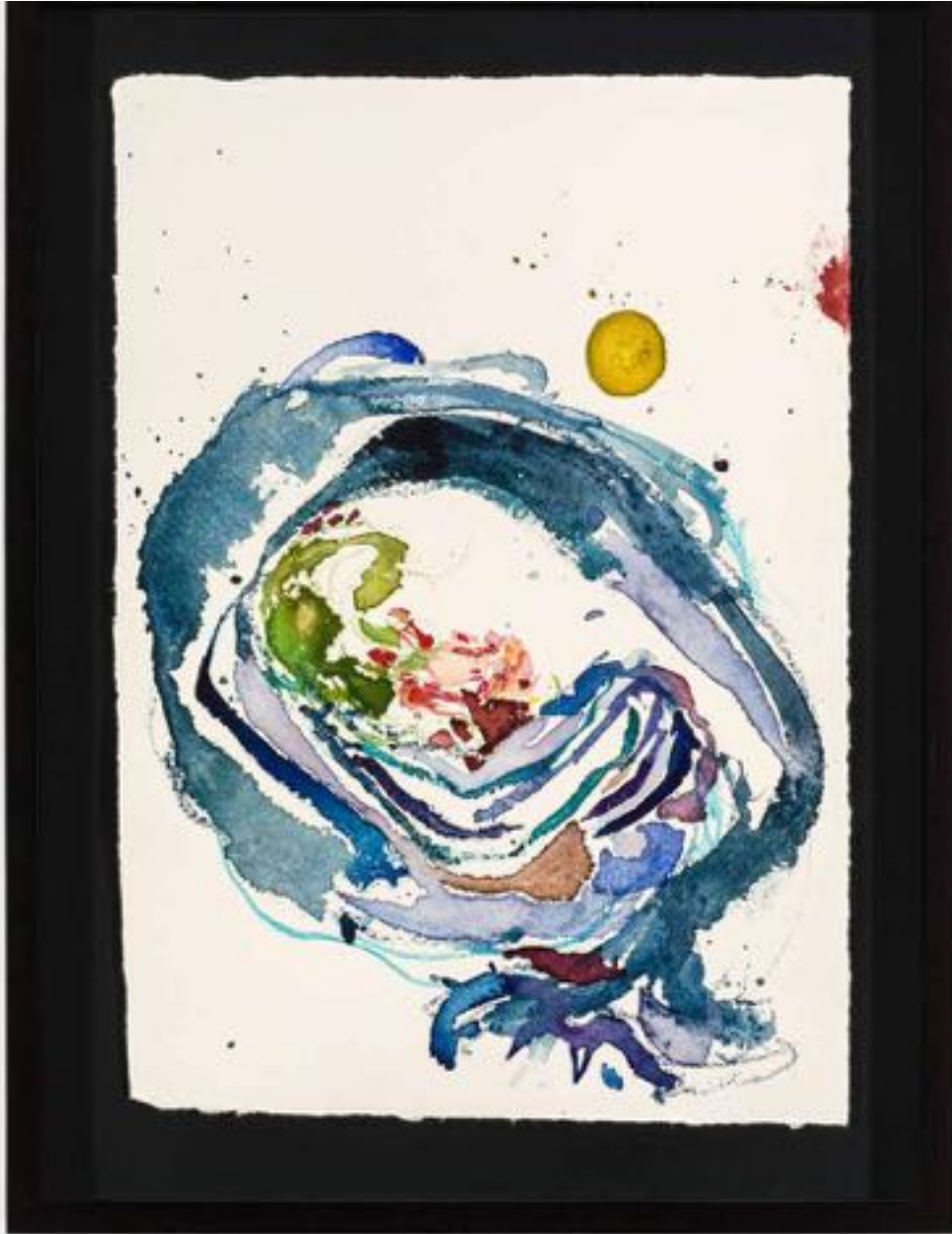
Miryam HADDAD La fonte des cieux , 2020 ref 12280 Aquarelle, papier Watercolour, paper 36 x 27 cm (14 1/8 x 10 5/8 in.)

Art: Concept 4 passage Sainte-Avoye, Paris 0033 1 53 60 90 30 www.galerieartconcept.com