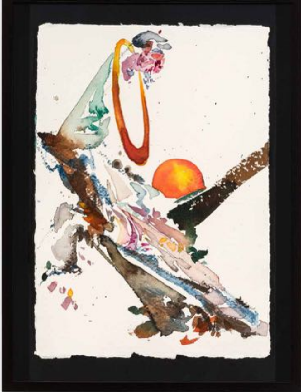
Miryam HADDAD La fonte des cieux , 2020 ref 12282 Aquarelle, papier Watercolour, paper 36 x 27 cm ( 14 1/8 x 10 5/8 in. )

Art : Concept 4 passage Sainte-Avoye, Paris 0033 1 53 60 90 30 www.galerieartconcept.com