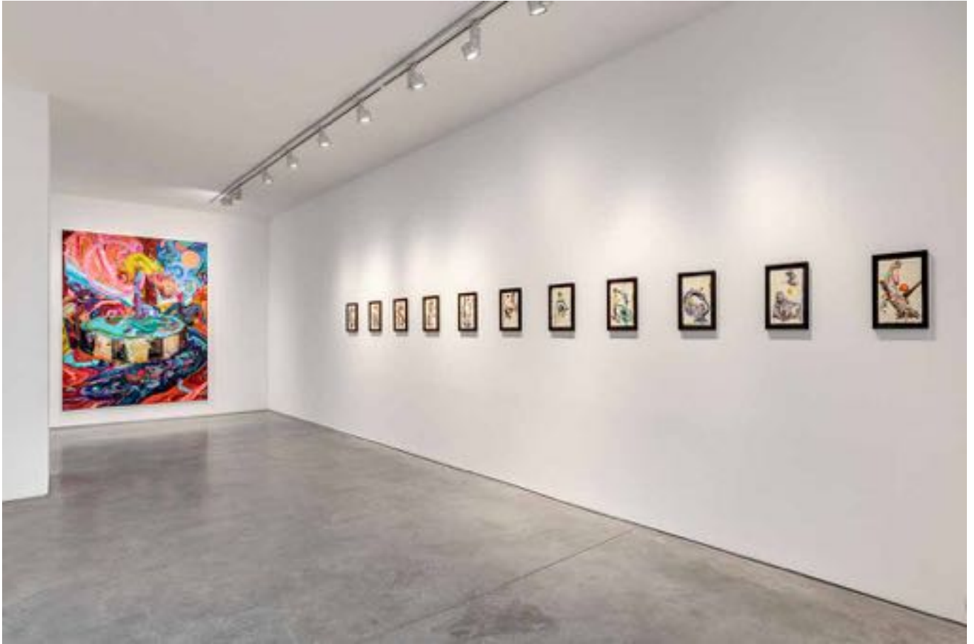
La plainte de Yam, Vue d'exposition, Art : Concept, Paris, 12 septembre - 24 octobre 2020 La plainte de Yam, Installation view, Art : Concept, Paris, 12th September - 24th October 2020

Art : Concept 4 passage Sainte-Avoye, Paris 0033 1 53 60 90 30 www.galerieartconcept.com