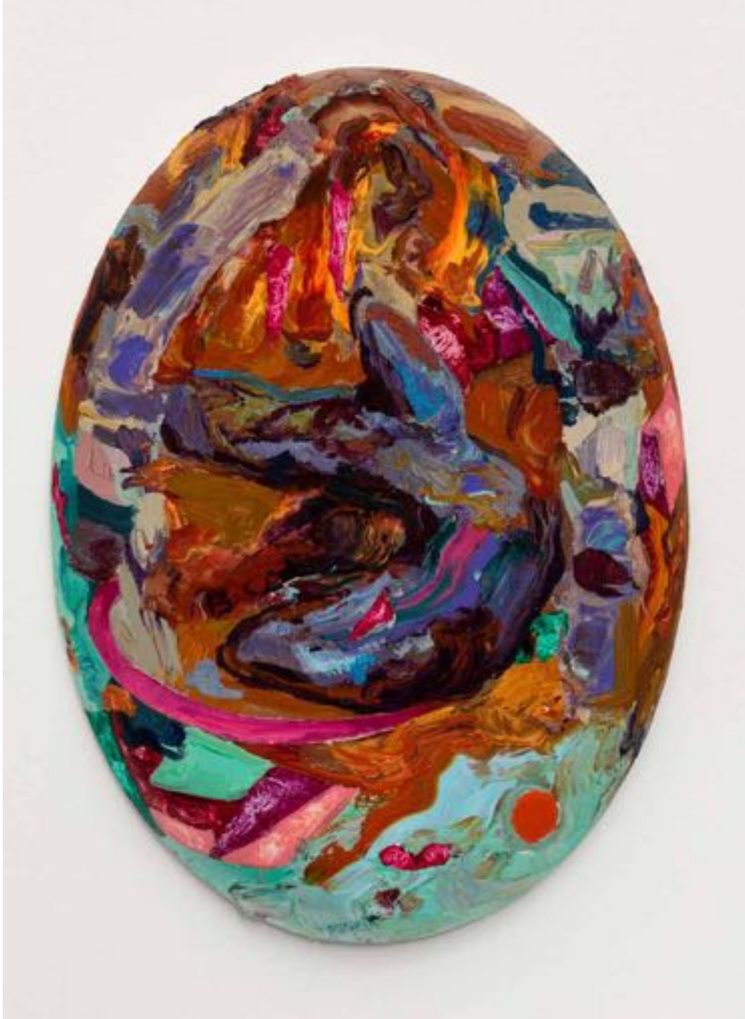
Miryam HADDAD La moisson de l'Aube , 2020 huile sur toile oil on canvas 26 x 20 cm (10 1/4 x 7 7/8 in.)

Art : Concept 4 passage Sainte-Avoye, Paris 0033 1 53 60 90 30 www.galerieartconcept.com