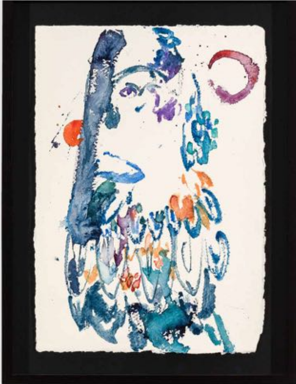
Miryam HADDAD La fonte des cieux , 2020 ref 12276 Aquarelle, papier Watercolour, paper 36 x 27 cm (14 1/8 x 10 5/8 in.)

Art : Concept 4 passage Sainte-Avoye, Paris 0033 1 53 60 90 30 www.galerieartconcept.com