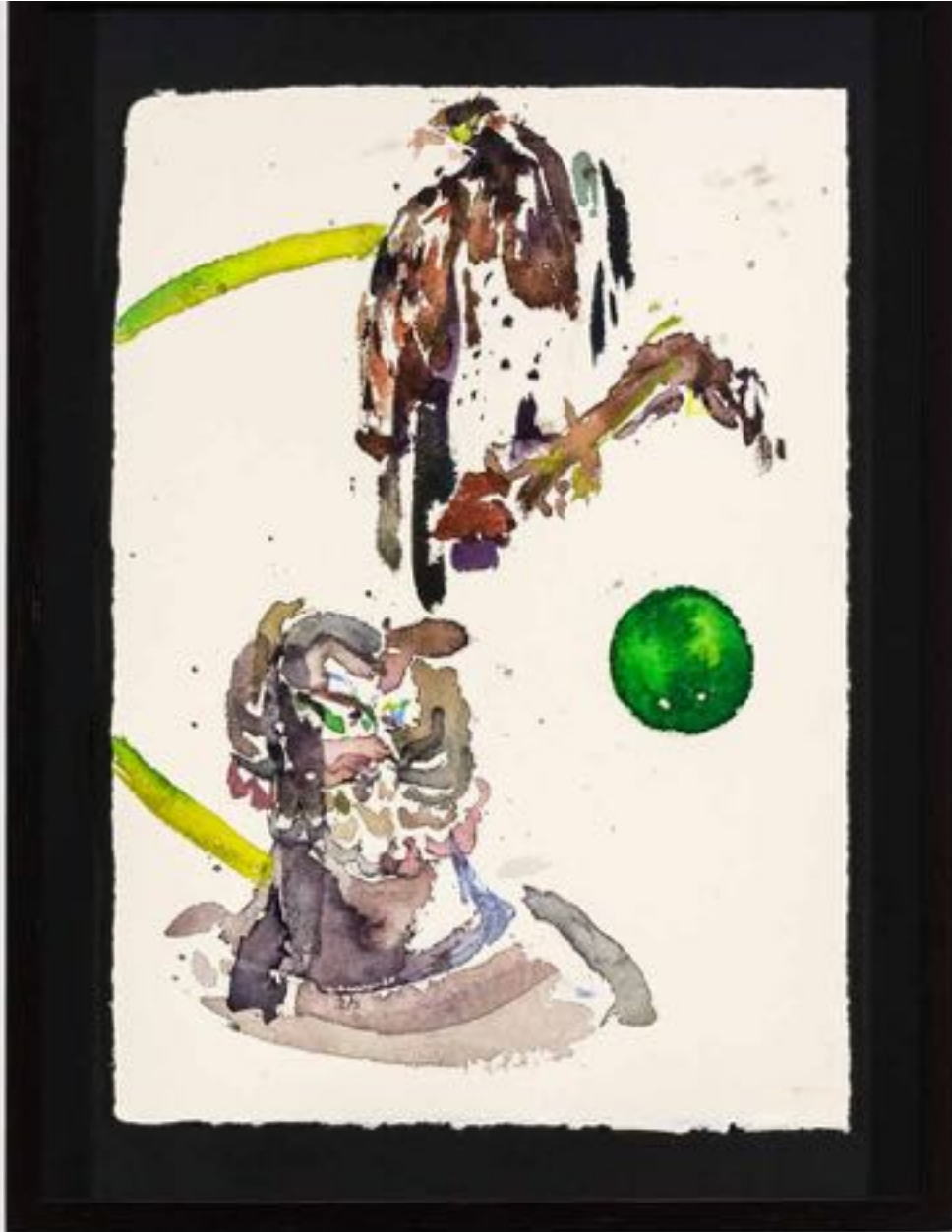
Miryam HADDAD La fonte des cieux , 2020 ref 12275 Aquarelle, papier Watercolour, paper 36 x 27 cm (14 1/8 x 10 5/8 in.)

Art : Concept 4 passage Sainte-Avoye, Paris 0033 1 53 60 90 30 www.galerieartconcept.com