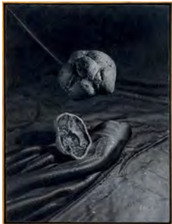
The Argon Welder II 2019 64,5 x 48,8 cm oil on canvas