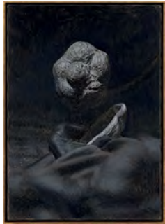
The Argon Welder VII 2019 53,0 x 38,9 cm oil on canvas