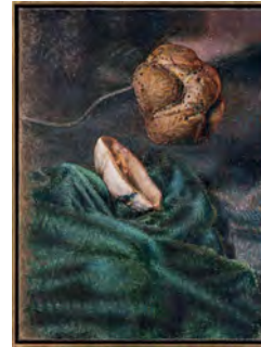
The Argon Welder XI 2019 49,4 x 37,2 cm oil on canvas