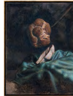
The Argon Welder XII 2019 52,9 x 41,2 cm oil on canvas