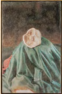
The Argon Welder I 2019 68,8 x 45,4 cm oil on canvas