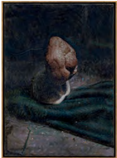
The Argon Welder VIII 2019 53,2 x 38,2 cm oil on canvas