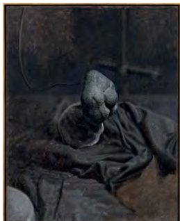
The Argon Welder X 2019 65,5 x 52,7 cm oil on canvas