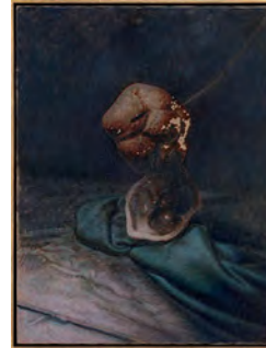
The Argon Welder IV 2019 62,2 x 47,8 cm oil on canvas