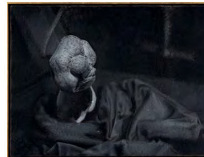
The Argon Welder XIV 2019 44,2 x 58 cm oil on canvas