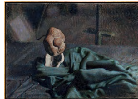
The Argon Welder XIII 2019 54,5 x 76,3 cm oil on canvas