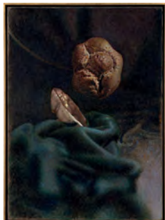
The Argon Welder III 2019 58,5 x 43,2 cm oil on canvas