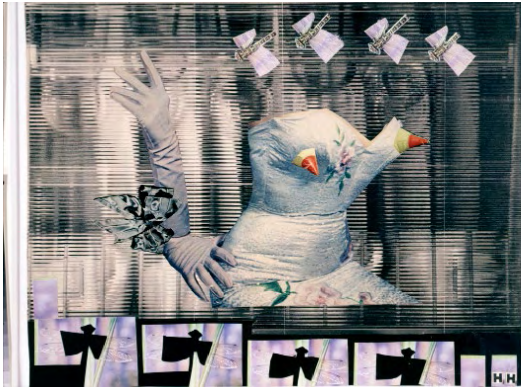
Hannah Höch, Entartet, 1969