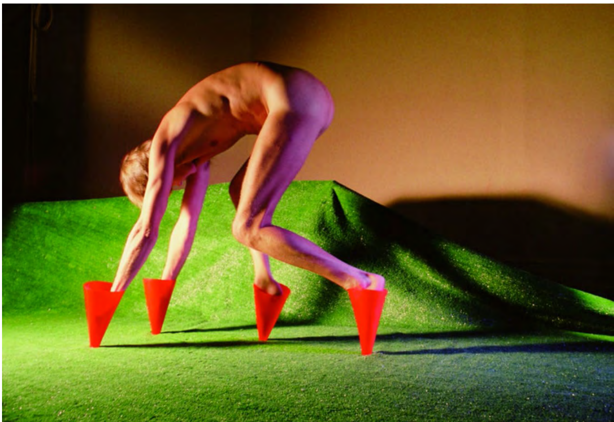
Jimmie De Sana, Marker Cones , 1982