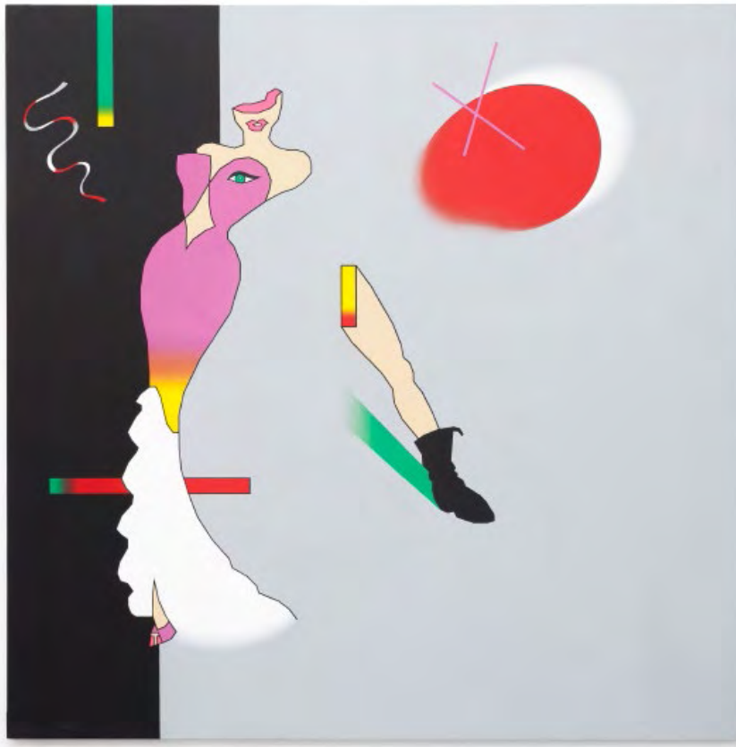
Duggie Fields, Metaphysical Leg-Pull , 1976 © the artist, Courtesy The Modern Institute