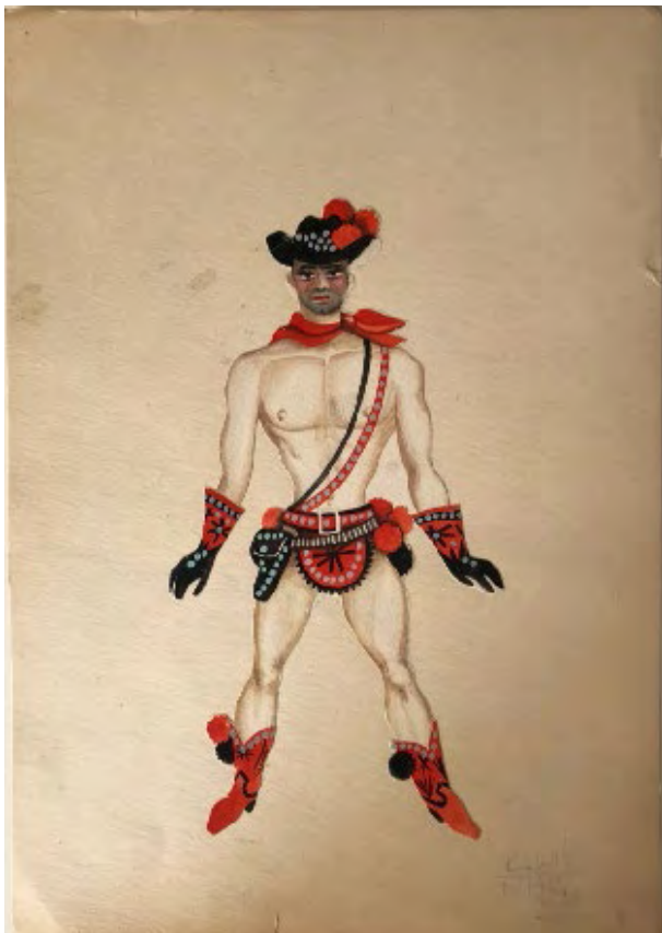
Kazimierz Wiśniak, Untitled , approx. 1960s © the artist, Courtesy Michał Kozurno