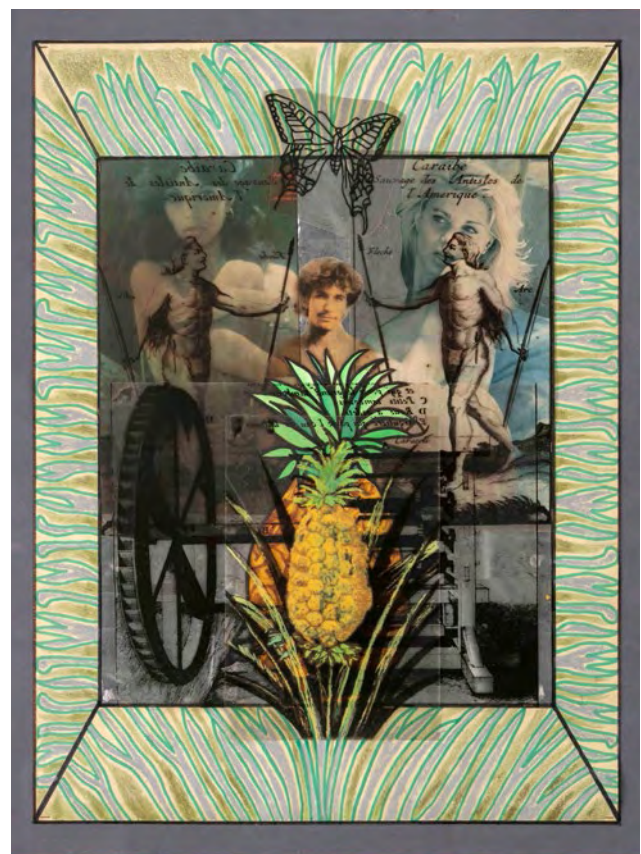
Raúl Martínez, Untitled