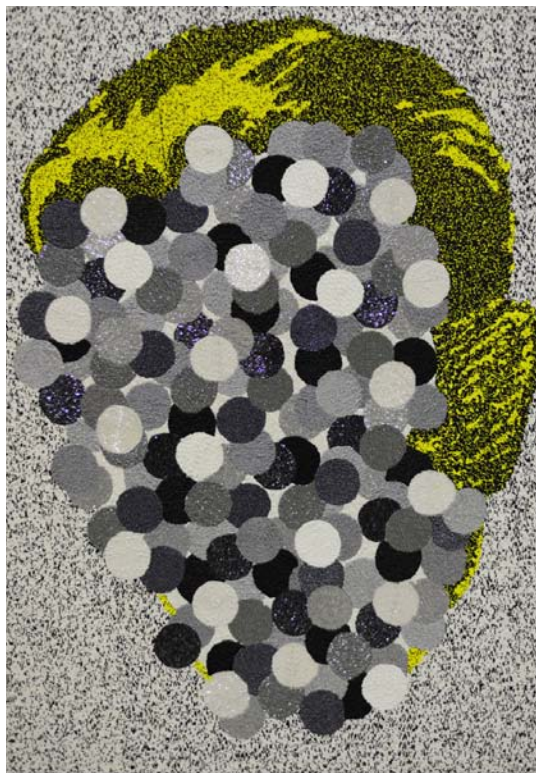
(left) "Curl" 2012 diptych Broderie sur toile embroidery on canvas 95 x 150 cm / 37 1/2 x 59 inches each