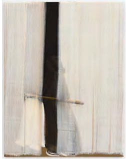
Brushstrokes - Diagram 2019 150 x 115 cm tempera on canvas