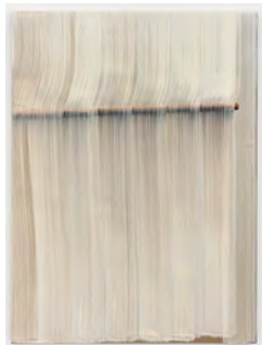
Brushstrokes - Diagram 2019 190 x 140 cm tempera on canvas