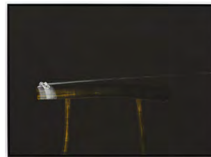
18 Brushstrokes 2014 130 x 180 cm tempera on canvas