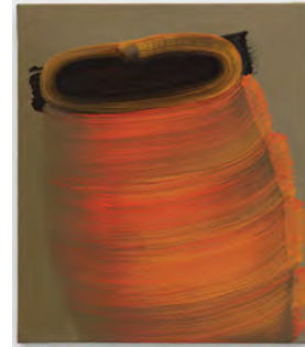
6 Brushstrokes 2013 47 x 41 cm tempera on canvas