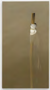
9 Brushstrokes 2017 130 x 70 cm tempera on canvas