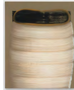
7 Brushstrokes 2018 120 x 100 cm tempera on canvas