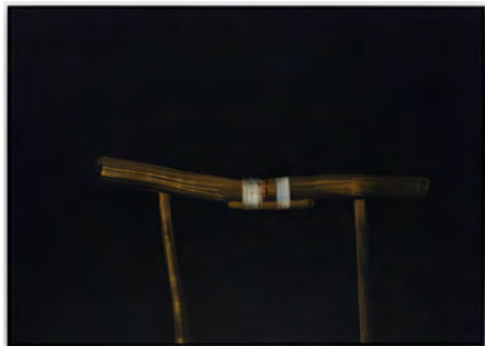
8 Brushstrokes 2018 170 x 240 cm tempera on canvas