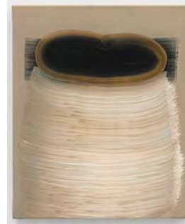
4 Brushstrokes 2018 54 x 46 cm tempera on canvas