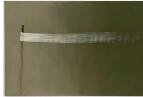
3 Brushstrokes 2017 160 x 240 cm tempera on canvas