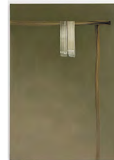
7 Brushstrokes 2017 170 x 120 cm tempera on canvas