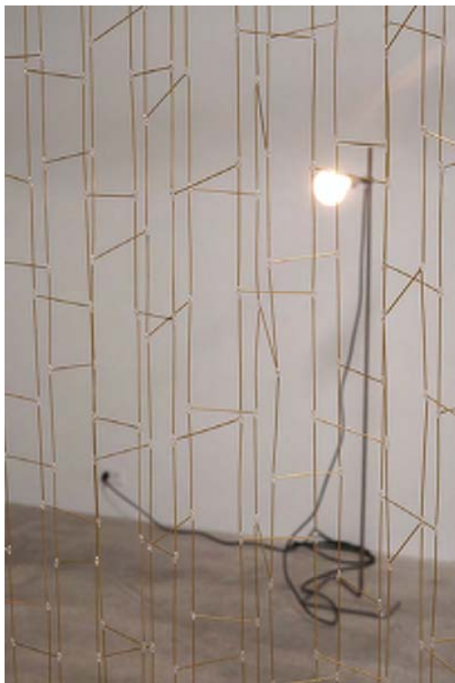
Lina , tubes en laiton, 2 x 5 m, 2012, second plan : Assembled, moved, re-arranged and scrapped continuously , bois de noyer, acier inoxydable, 2012

For her second exhibition at Air de Paris, Leonor Antunes is presenting a series of new sculptures based on the measurements of specific Modernist buildings. Works that are reversals of reversals: nothing less than taking the anti-Modernist gambit identified by Rosalind Krauss in her "Notes on the Index" (1977) – use of a referent external to the work, in contrast with Modernism's purist rationale – and applying it to referents in the form of iconic, overtly Modernist works of architecture. Just as the artist did with the work of designer Eileen Gray in her Paris exhibition at Crédac in 2008.