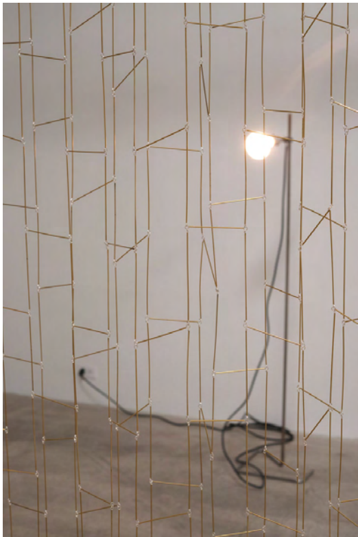
Lina , tubes en laiton, 2 x 5 m, 2012, second plan : Assembled, moved, re-arranged and scrapped continuously , bois de noyer, acier inoxydable, 2012

Pour sa seconde exposition à Air de paris, Leonor Antunès présente une série de nouvelles sculptures réalisées à partir de mesures prises sur des constructions modernistes. Ses réalisations sont autant de retournements de retournement : elle opère rien de moins que le geste anti-moderniste (du type de celui que Rosalind Krauss identifiait dans ses Notes sur l'index , 1977, et qui consiste à utiliser un référent extérieur à une œuvre – par opposition à la logique de pureté du médium moderniste) sur des référents ostensiblement modernistes – des constructions architecturales emblématiques (ainsi qu'elle l'avait fait avec Eileen Gray pour son exposition au Crédac en 2008).